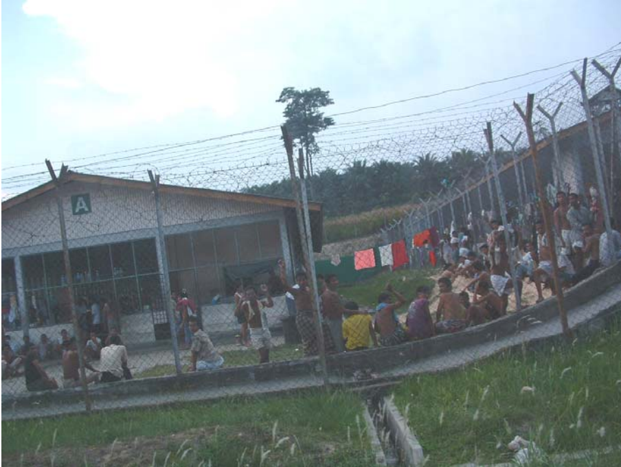
Bildet viser en detention-leir utenfor Kuala Lumpur, hvor flyktninger stues sammen på små områder i påvente av å transporteres ut av Malaysia. ( UDI 2004 ).

I mange tilfeller kan flyktningene gå fri ved å betale politiet penger, men det skjer også at flyktninger blir uttransportert fra Malaysia. Flyktningene blir da uttransportert til Thailand, der thailandske myndigheter i noen tilfeller overbringer flyktningene til burmesiske myndigheter eller internerer dem. Mange forsvinner også etter slike uttransporteringer. Situasjonen gjør at flyktningene føler seg utrygge i Malaysia og stadig flytter til nye steder i landet for å unngå problemer. Mange av flyktningene lever av lave inntekter fra svart arbeid. De bor ikke i flyktingleire, men mer eller mindre skjult i og rundt byene. Barn av flyktninger har ikke tilgang til skole i Malaysia.