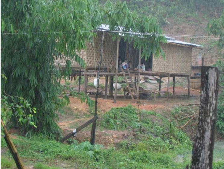
Bildet over er fra landsbyen Sanklaburi, på grensen mellom Burma/Myanmar og Thailand. Her bor mange burmesiske flyktninger i slike hus som avbildet. Som regel leier de rom hos en thailandsk familie (UDI 2004).

På grunn av de vanskelige forholdene i hjemlandet kom det i 2003 ca. 2.500 flyktninger over grensen til Thailand hver eneste måned. 116.700 personer er registrert i ni flyktningleire langs grensen, i tillegg til ca. 20.000 i grenseområdene som ikke bor i leirene, og 5.000 som oppholder seg i Bangkok eller andre byer 13 .