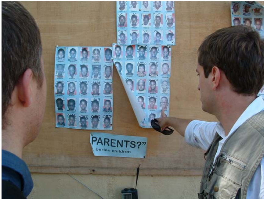
Mange av flyktingene i Buduburam (Ghana) har savnede familiemedlemmer som har forsvunnet under flukten fra Liberia. På bildet vises en av tavlene i Buduburam med barn som leter etter foreldrene sine (UDI 2004).

Mange av flyktingene som UNHCR velger ut for gjenbosetting fra Ghana har spesielle sikkerhetsbehov, som enslige kvinner med barn, mens noen få har spesielle behov knyttet til helse.