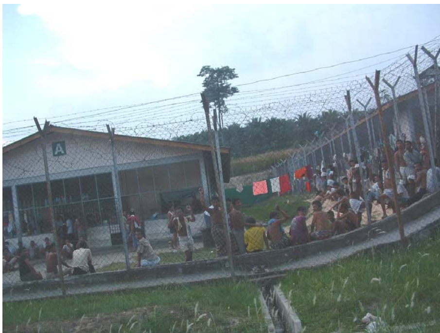
Bildet viser en detention-leir utenfor Kuala Lumpur, hvor flyktninger stues sammen på små områder i påvente av å transporteres ut av Malaysia. (UDI 2004).

I mange tilfeller kan flyktingene gå fri ved å betale politiet penger, men det skjer også at flyktinger blir uttransportert fra Malaysia. Flyktingene blir da uttransportert til Thailand, der thailandske myndigheter i noen tilfeller overbringer flyktingene til burmesiske myndigheter eller internerer dem. Mange forsvinner også etter slike uttransporteringer. Situasjonen gjør at flyktingene føler seg utrygge i Malaysia og stadig flytter til nye steder i landet for å unngå problemer. Mange av flyktingene lever av lave inntekter fra svart arbeid. De bor ikke i flyktingleire, men mer eller mindre skjult i og rundt byene. Barn av flyktinger har ikke tilgang til skole i Malaysia.