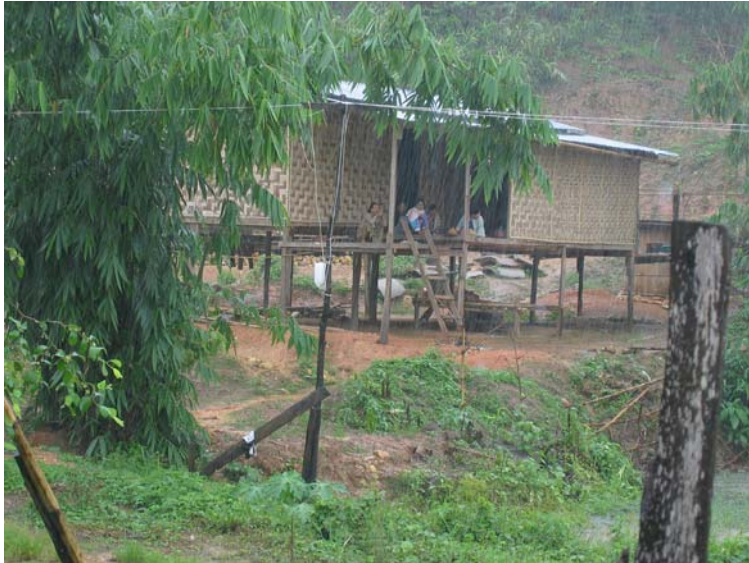
Bildet over er fra landsbyen Sanklaburi, på grensen mellom Burma/Myanmar og Thailand. Her bor mange burmesiske flyktninger i slike hus som avbildet. Som regel leier de rom hos en thailandsk familie (UDI 2004).

Thailand har verken sluttet seg til flyktningkonvensjonen av 1951, eller tilleggsprotokollen av 1967. Opp gjennom tidene har myndighetene valgt ulike måter å håndtere den store strømmen av flyktninger til landet på. De siste årene har Thailand bedret sitt forhold til militærregimet i Burma/Myanmar og vist stadig mindre vilje til å gi hjelp og beskyttelse til flyktninger. Dette har særlig skjedd under den sittende regjering i Thailand. Myndighetene bestemte i januar 2004 at UNHCR ikke lenger får vurdere hvem som har rett på flyktningstatus. Thailandske myndigheter skal nå selv avgjøre flyktningenes status, men myndigheten har ikke noe apparat til å utføre denne jobben.